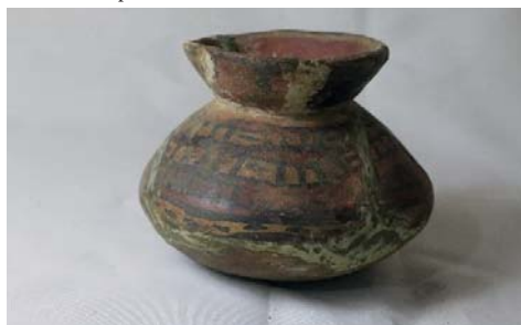
Vasija 2.- Con representación pictórica de bandas, rayas y puntos encerrados. Modelado y pintado. Museo Aticus. Fase Nasca 9? (local)