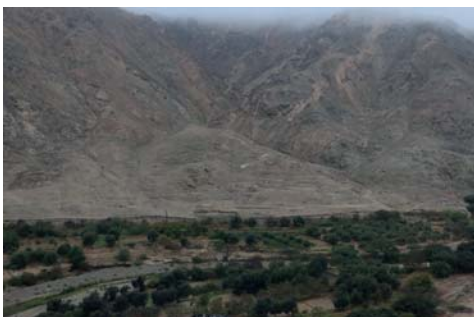
Vista general de la zona arqueológica del "Curaca", margen derecha del rio Atico

En los últimos años el sitio ha sido alterado por acción de la huaquería, habiéndose recuperado parte de sus materiales arqueológicos, los que a continuación detallaremos: