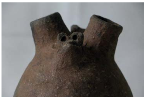
Vasija 4.- Botella con dos picos, con representación escultórica de personaje con ojos saltones, sin decoración. Museo Aticus. ¿Estilo La Ramada?