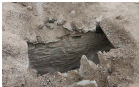
Vista de algunas estructuras de "El Curaca", son construidas con piedra canteada unido con argamasa