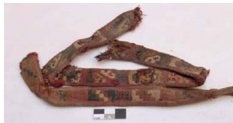
Textil 5.- Técnica: Doble Tela, Diseño Escalonado. Faja 37 x 02 cm). Horizonte Medio 600 – 900 d.C.

ración parece ser más local, y por las descripciones estas tres muestras textiles son regionales del Horizonte Medio, propios de la Región Arequipa, lo que indicaría una aparente fuerte interacción entre la costa central a través de los Wari con Arequipa