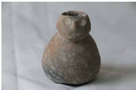
Vasija 5.- Botella escultórica con representación de una cara en alto relieve, que definen los ojos, nariz y boca, sin decoración. Museo Aticus. ¿Estilo La Ramada?