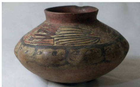
Vasija 1.- Con representación pictórica de caras. Modelado y pintado. Museo Aticus. Fase Nasca 8