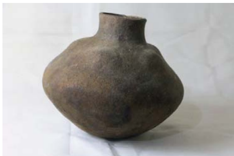
Vasija 3.- Cántaro globular escultórica, sin decoración con protuberancias, base cóncava. Museo Aticus. ¿Estilo La Ramada?