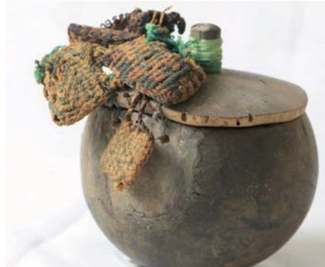
Caja pequeña de cucurbitácea con una tapa en la parte superior, donde han insertado pequeñas bolsas de textiles que están sujetado a un palito de madera, el textil es una faja doble tela reps de urdimbre diseño en zigzag y antropomorfa. Época: Intermedio Temprano – Horizonte Medio función: ¿guardar o depositar alguna sustancia? (calero)