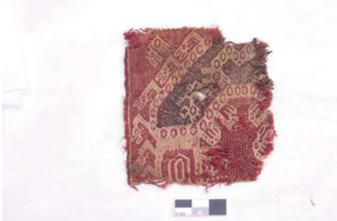
Textil 4.- Técnica Tapiz reforzado, (11 x 10 cm), fibra de camélido y algodón, diseños estilizados de peces, aves y batracios. Museo Aticus. Época: Horizonte Medio 2B y 3

Estos tejidos excepcionales son propios del Horizonte Medio, por su iconografía y su técnica de elaboración. (Comunicación personal Rommel Ángeles)