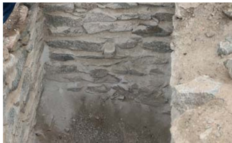
Vista con más detalle del aparejo de un muro del sitio de "El Curaca", con buen acabado en su construcción