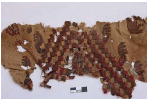
Textil 1.- Técnica brocado con urdimbres discontinuas, fibra de camélido y algodón (33 x 17 cm.), diseño en damero con cabezas de aves. Museo Aticus. Época: Horizonte Medio 2B y 3