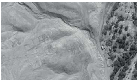
Vistas Satelitales del Google Earth de la zona arqueológica de "El Curaca", con detalle de algunas estructuras