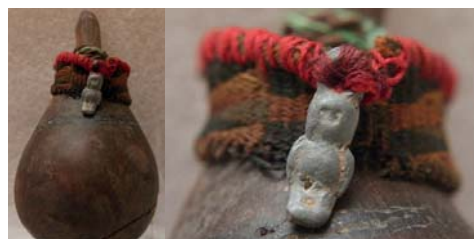
Cucurbitácea pequeña, con pirograbado, la que está sujetando un palo pequeño con un textil tipo faja con técnica de doble tela, con diseño geométrico, y un objeto de metal (búho). (¿Calero, depósito de sustancia?). Época: Intermedio Temprano