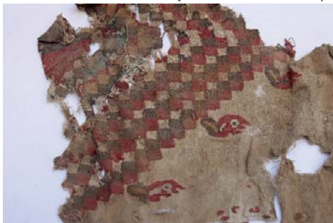
Textil 2.- Técnica brocado con urdimbres discontinuas, fibra de camélido y algodón (41 x 30 cm.), diseño en damero con cabezas de aves. Museo Aticus. Época: Horizonte Medio 2B y 3