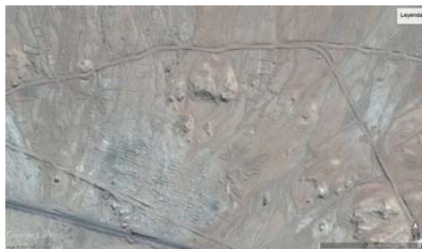
Google Earth, con vista de la zona arqueológica de Puyenca