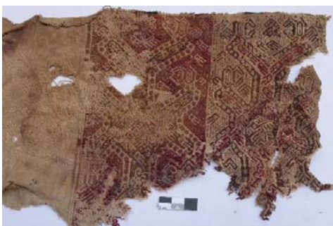
Textil 3.- Técnica Tapiz reforzado, (31 x 20 cm), fibra de camélido y algodón, diseños estilizados de peces, aves y batracios. Museo Aticus. Época: Horizonte Medio 2B y 3