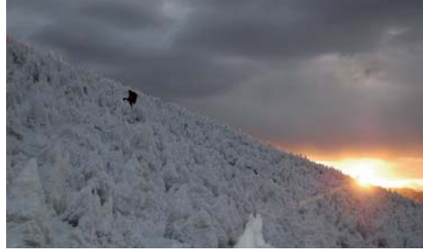
Figura 06. Coropuna 3

- NEVADO SARA SARA: Este se ubica en la región Ayacucho, Perú. En esta montaña realizamos las siguientes expediciones: