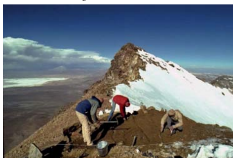
Figura 09. Pichu Pichu 2

yacente a este llamado Sabancaya, lo que provocó que las cenizas de esta erupción, cayera al nevado Ampato y poco a poco el glaciar de este fuera derritiéndose. Y según comentarios de un andinista que había ascendido a la montaña, indica que en la ascensión había encontrado Ichu (gramínida andina que crece desde los 2500 hasta los 4500 msnm.), y algunos vestigios culturales como maderas, cuerdas, y estructuras.