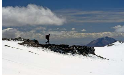
Figura 21. Quehuar 1999 #51 Inca platform near summit 2-17-99

cigarros y otros que datan de la década del setenta, y por el material encontrado pertenecía el ejército argentino. Nos dimos cuenta que seguramente con la intención de sacar los "tesoros", estos personajes habían dinamitado la plataforma, destruyéndola y destruyendo el cuerpo del niño que se encontraba en su tumba.