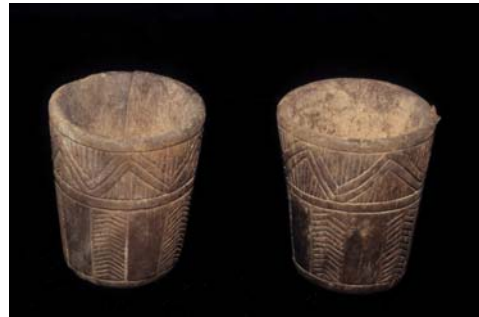
Figura 13. Ampato 5.jpg