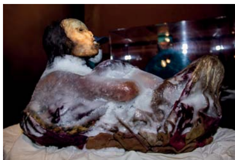
Figura 17. Ampato 9

- EL VOLCAN MISTI: Ubicado a 15 Km. de la ciudad de Arequipa, este es un volcán que en la actualidad se encuentra activo. Fue muy importante para los Incas, ya se le menciona que este erupción por el año de 1490 aproximadamente, Fray Martín de Murua en sus crónicas menciona que cuando estaba Inca Yupanqui (Pachacutec) de gobernador, este volcán erupción provocando mucha destrucción y desolación, nos dice que no quedo gente viva en la ciudad; es así que nos narra que el mismo Inca, acompañado de su esposa Hipa Huaco deciden ascender al volcán para realizar esta ceremonia