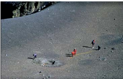
Figura 20. Misti 2

- EL NEVADO QUEWAR: Se ubica en la provincia de Salta, Argentina. En el mes de Enero de 1999, se realiza la expedición científica a este nevado, en la cumbre se ubica la plataforma ceremonial, el lugar estaba disturbado, se encuentra elementos como