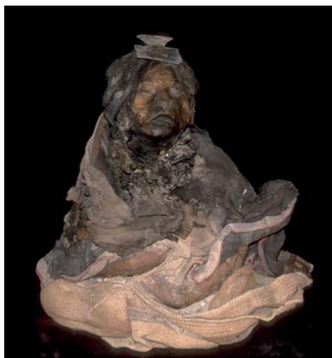
Figura 27. Llull Girl #1 Youngest female mummy