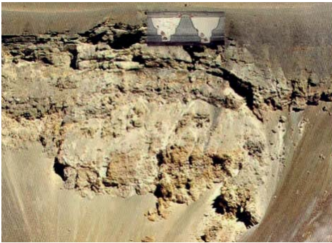
Figura 19. Misti 1

Excavamos hasta casi los 4m. de profundidad y logramos rescatar varias ofrendas como cerámica, objetos metálicos y de espondillus.