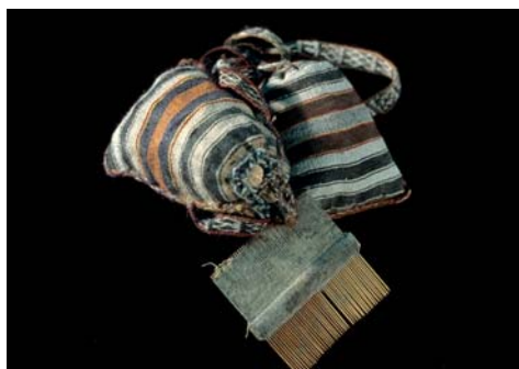
Figura 25. Llull Artifacts #28 Bags (N-10a & N-10b) & comb (N-7)