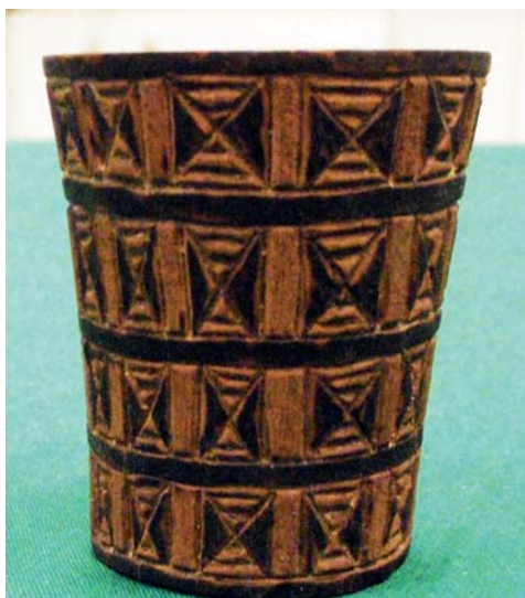
Figura 24. Llull Artifacts #87 Kero (N-12) 3-12