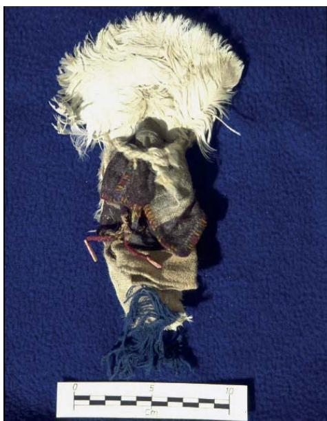
Figura 16. Ampato 8