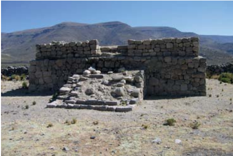
Figura 05. Coropuna 2

En 1982, se hace un nuevo reconocimiento del nevado, para poder encontrar la ruta que siguieron los Incas para la ascensión del mismo, hallando a los 4500m.s.n.m unas estructuras que parecían un canal de agua.