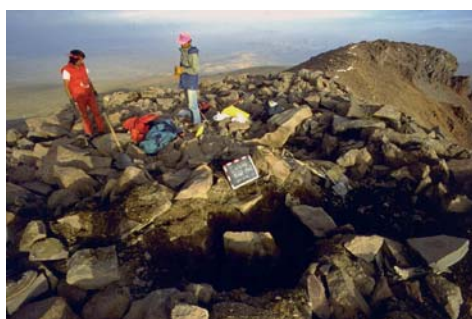
Figura 03. Calcha 1

- NEVADO CALCHA: Ubicado en la región Arequipa, Perú; se realiza el ascenso en setiembre de 1982, no se realiza excavaciones, en la parte superior del nevado se halla estructuras rectangulares realizadas por los Incas.