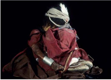
Figura 28. Llull Boy #2