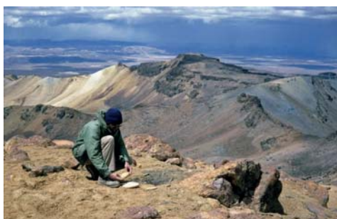
Figura 01. Huarancante 1

- NEVADO HUARANCANTE: Se ubica al nor-oeste de la ciudad de Arequipa, Perú, en el valle del Colca. Aquí se realizó las siguientes temporadas de investigación: