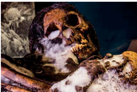
Figura 08. Sara Sara 2

- NEVADO PICHU PICHU: Se sabe que a esta montaña que está ubicada a unos 20 Km. De la ciudad de Arequipa, Perú; en el año de 1964, ascienden unos andinistas y saquean la tumba de un niño, como no tienen instrumentos para hacer excavaciones sacan la cabeza de un niño y algunos objetos que este tenía, por suerte la policía peruana logra incautar este material. En esta montaña se realizó las siguientes expediciones: