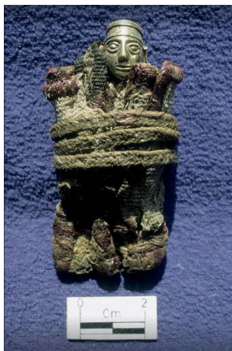
Figura 02. Huarancante 2