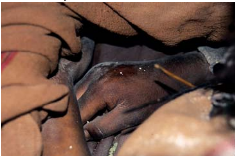
Figura 31. Llull Maiden #27 Hands