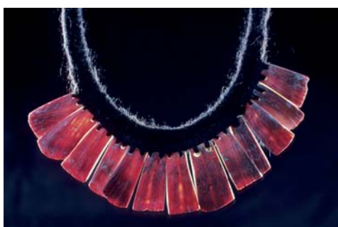
Figura 23. Llull Artifacts #2 Spondylus Shell Necklace S-22