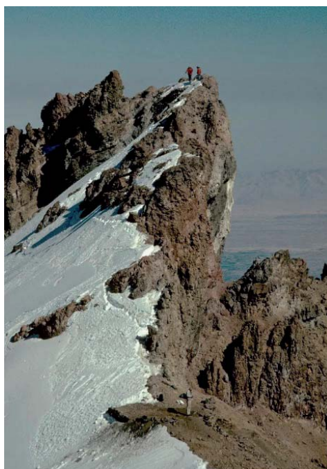
Figura 08. Pichu Pichu 1

- NEVADO AMPATO: Ubicado en la región Arequipa, Perú. Si bien esta es una montaña o Apu sagrado para los Incas, no estaba en los planes del Proyecto Santuarios Andinos, debido a que esta montaña presenta un glaciar, lo que hace casi imposible ubicar los sitios del ritual. Pero en 1990 empieza a erupcionar el volcán ad-