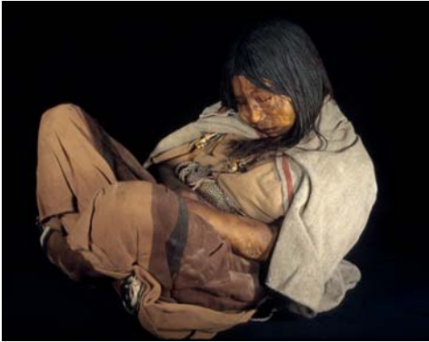
Figura 29. llullaillaco 3