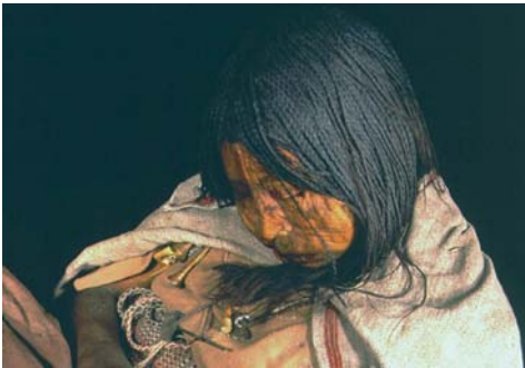
Figura 30. Llull Maiden #15 356 K