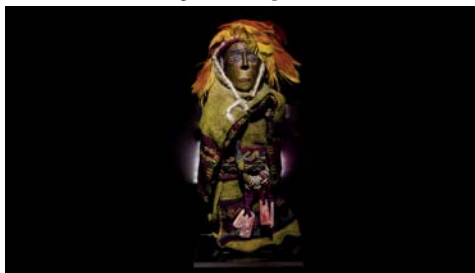
Figura 15. Ampato 7