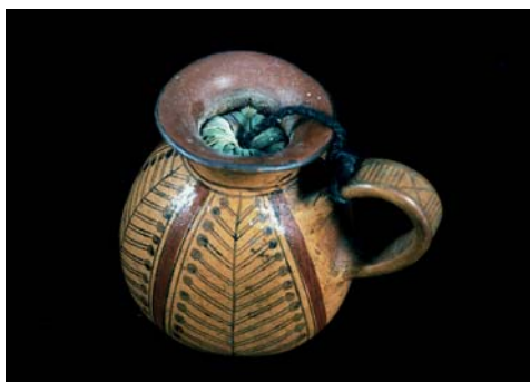
Figura 22. Llull Artifacts #30 Stirrup pot N-22