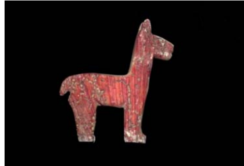
Figura 12. Ampato 4