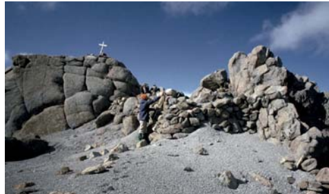
Figura 07. Sara Sara 1