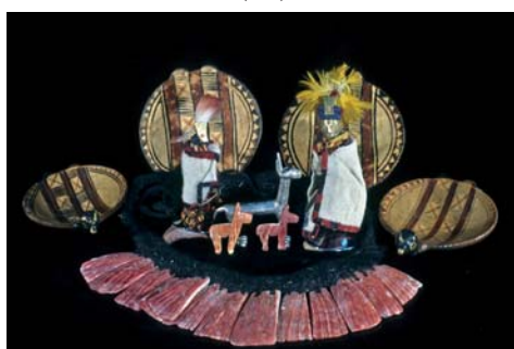
Figura 26. Llull Artifacts #60 Artifacts with spondylus necklace