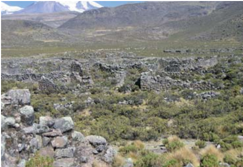
Figura 04. Coropuna 1