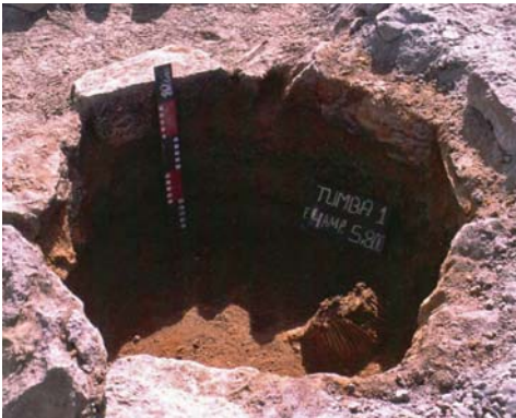
Figura 10. Ampato 2.jpg

Luego al siguiente mes se realiza la expedición científica, logrando ubicar una plataforma ceremonial en los 5800 msnm., logrando rescatar dos niños con sus respectivas ofrendas; objetos de cerámica, de madera, textiles, objetos metálicos y de espondillus.