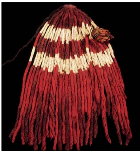
Figura 14. Ampato 6